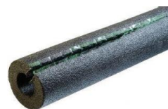
AISLANTE PARA TUBO Insul-Lock 1.83mts largo 3/8" pared - Uso plomero y ferretero