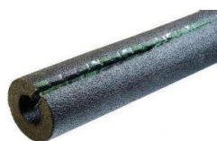
AISLANTE PARA TUBO Insul-Lock 1.83mts largo 1/2" pared - Uso plomero y ferretero